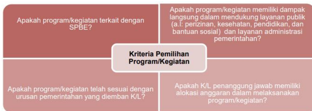
Gambar Ilustrasi Pemilihan Program/Kegiatan

Seperti halnya, apabila terdapat dua program yang memiliki tingkat kepentingan yang sama (memiliki peringkat efektivitas yang sama), maka faktor kelayakan dan efisiensi akan menentukan suatu program memiliki prioritas yang lebih tinggi dibandingkan program yang lain. Selain itu beberapa faktor lain juga menentukan dalam pemilihan program/kegiatan SPBE, sebagaimana ilustrasi pada Gambar Ilustrasi Pemilihan Program/Kegiatan.